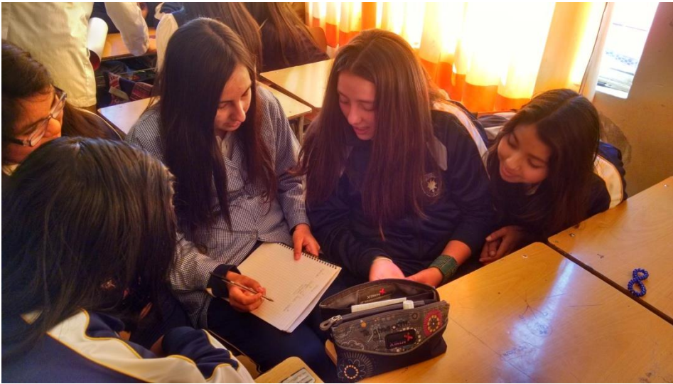
Niñas elaboran un diálogo y luego representan en un sketch, la evolución del cristianismo durante el Imperio Romano y sus implicancias en occidente.