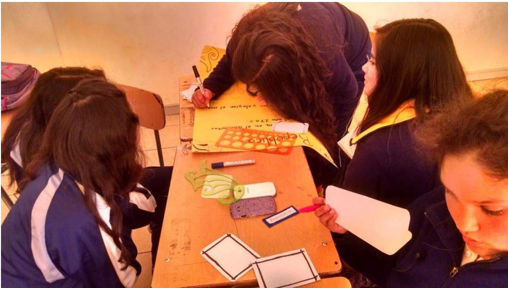
Niñas trabajan en la actividad concerniente a la República, elaboran un mapa conceptual.