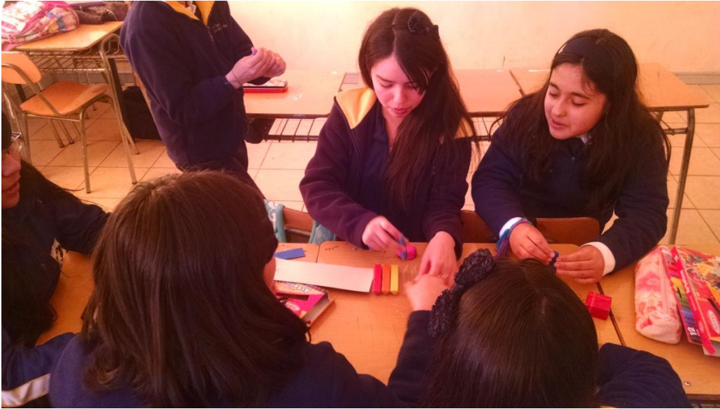
Niñas trabajan en la fabricación de figuras arquitectónicas, características del Legado Romano.