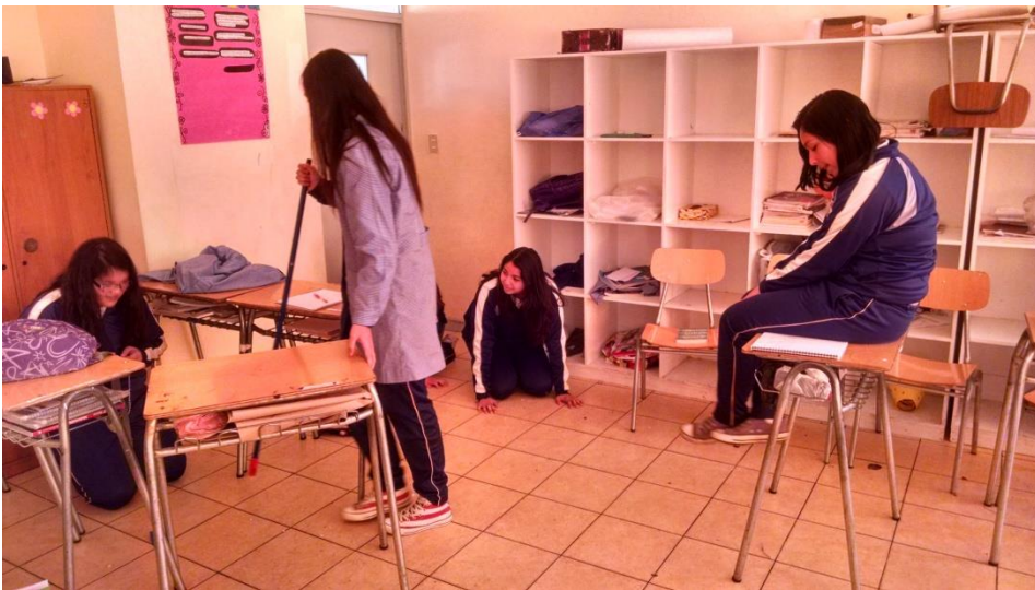
Niñas presentan su diálogo a sus compañeras, mediante una representación teatral