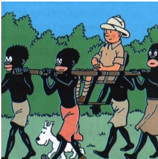
Ilustración 2. Hergé. (1933). Tintín en el Congo.

En el cómic Tintín en el Congo (1931) de Hergé se grafica visualmente el esclavismo al que se veían sometidos los congoleños.