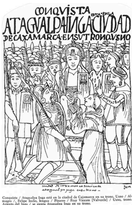
Ilustración 1. El dominico Vicente de Valverde, junto a Francisco Pizarro, lee el requerimiento a Atahualpa. Dibujo de Guaman Poma (1615).

Le Fevre (2015), explica que esta toma de territorio puede darse a través de un trato con los indígenas o bien por una simple “toma de posesión”, lo cual podemos ver ejemplificado en el caso de la conquista de Chile y América, en el momento en que los conquistadores les leían el Requerimiento a los pueblos originarios, con el cual se oficializaba la entrega de sus tierras a la Corona Española.