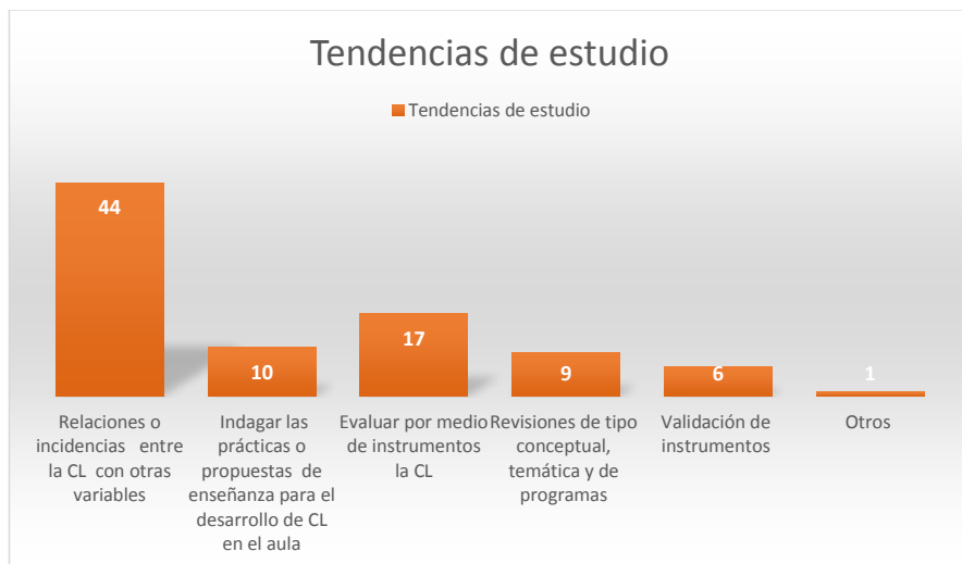
Figura 1 Tendencias de estudio

Del total de las temáticas evidenciadas en la búsqueda bibliográfica, la tendencia de estudio con más artículos a su haber es Relaciones o incidencias entre la Comprensión lectora con otras variables , pues cuenta con 44 de los 87 artículos seleccionados; le sigue la tendencia Evaluar por medio de instrumentos la comprensión lectora con 17 artículos, estableciéndose una diferencia numérica considerable; manteniendo esta constante, se encuentra la tendencia de Indagar las prácticas o propuestas de enseñanza para el desarrollo de la comprensión lectora en el aula , con 10 investigaciones; luego, y no tan lejano en cantidad, se encuentra Revisiones de tipo conceptual, temática y de programas , con 9 estudios del corpus estudiado; posteriormente, Validación de instrumentos , consta con 6 indagaciones investigativas; y finalmente, la tendencia denominada Otros , dado que no logra articularse ni construir una tendencia de estudio con otra investigación, cuenta con tan solo 1 artículo.