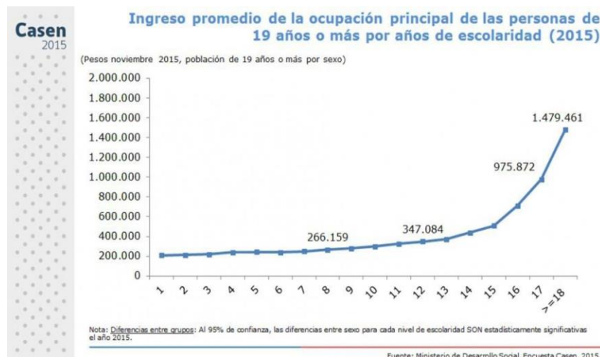
Figura 1: Ingreso promedio de la ocupación principal de las personas de 19 años o más por años de escolaridad (2015).

Este factor es muy importante de analizar, pues la situación de vulnerabilidad de quienes desertan muchas veces se mantiene de manera perpetua, ya que la deserción escolar, genera menos oportunidades de trabajo y por ende menor cantidad de ingresos.