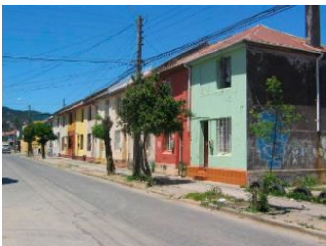
Imagen 2: Pabellones Población Fanaloza a inicios del siglo XXI, previo al terremoto del 2010.