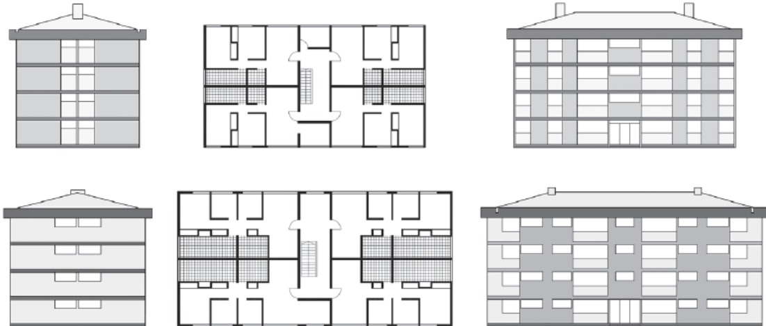
Conjuntos habitacionales: tipo 1010 arriba, tipo 1020 abajo.