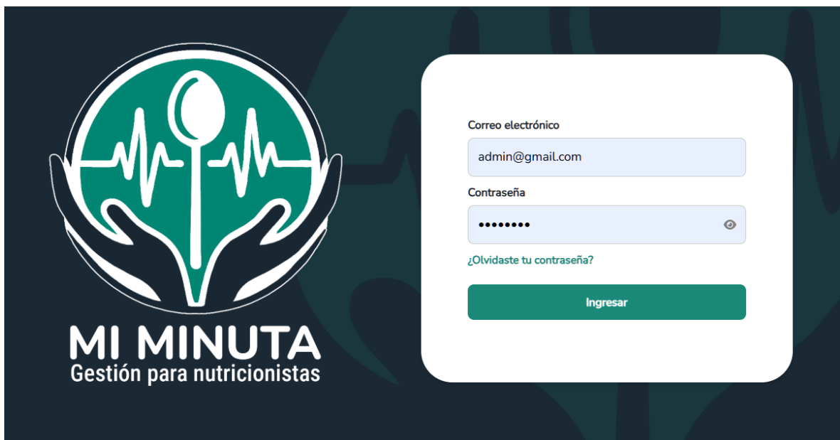
Figura 2 Login de miMinuta v2.0

Para evitar acciones accidentales, en las interfaces de mantenimiento se añadieron dobles confirmaciones antes de eliminar o desactivar registros, así como alertas visuales e iconos de carga que indicaran al usuario que una operación está en curso, reduciendo ambigüedades en la manipulación de datos. A nivel de backend se aseguraron los mensajes de error claros y consistentes, gestionados en logs en framework y en consola, nada visible para el usuario. En el frontend, la validación de formularios se combinó con las reglas de Laravel para garantizar la integridad de los datos. Finalmente, el módulo distingue vistas según el rol del usuario, mostrando en la pantalla principal solamente los menús y acciones para los cuales cada perfil tiene permiso, lo que refuerza tanto la seguridad como la usabilidad del sistema.