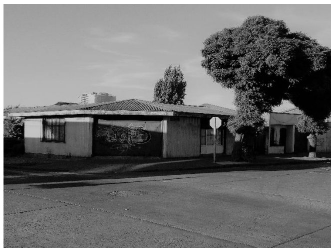
Fotografía de lo que es actualmente una pensión, conocida en la década de 1950 por ser un centro de prostitución llamado “ La tía Mercedes ”.