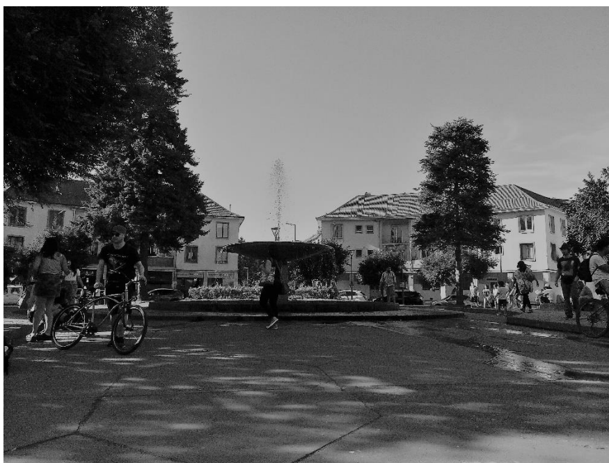
Fotografía de lo que es actualmente la Plaza Perú, conocida en la década de 1950 como el “ Barrio Gringo ”.