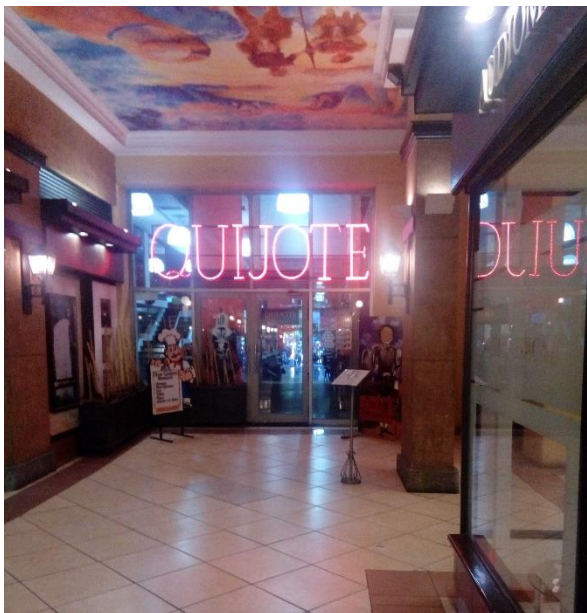
Fotografía de lo que es actualmente Restorán “Quijote”, conocida en la década de 1950 como el “Boîte y restaurant Quijote”.