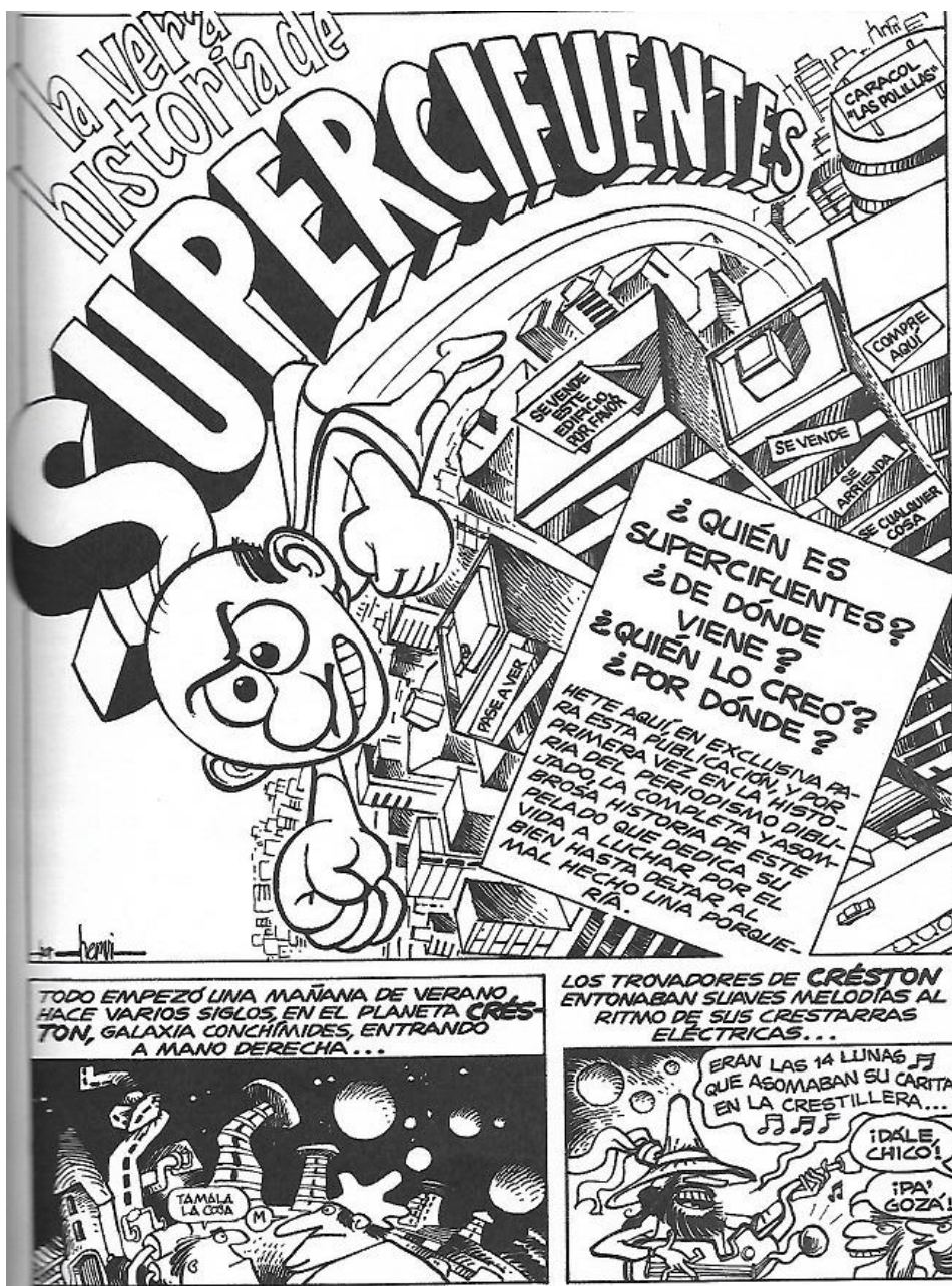
VIDAL, Hernán. (2008). Supercifuentes, el justiciero . Santiago, Chile: Ferores editores. pp. 61-67.