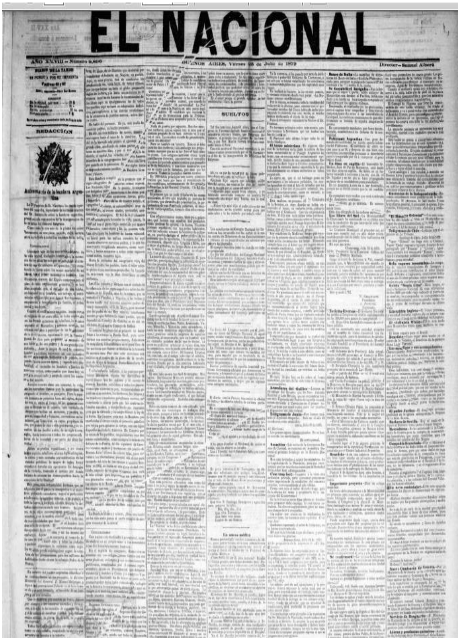
El Nacional, 25 de julio de 1879 Editorial Las candidaturas de guerra!