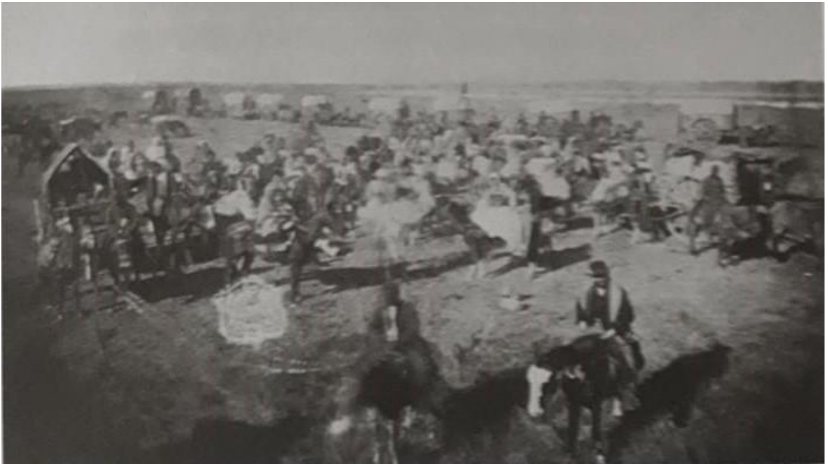
Luna, Félix (2004). Julio a. Roca. Buenos Aires: La Nación, p. 45. Convoy y familias del ejército en marcha. Junto a sus familias y las carretas para llevar las herramientas y municiones.