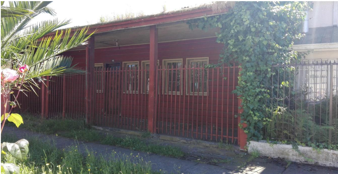
Imagen N°10. Pabellón de Emergencia ubicado en la calle Caupolicán con Manuel Rodríguez. Última vivienda en el sector que mantiene su fachada inicial.