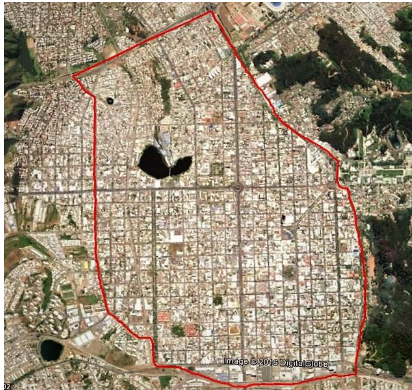
Imagen N° 2. Aproximación al radio urbano de Concepción, año 1931.