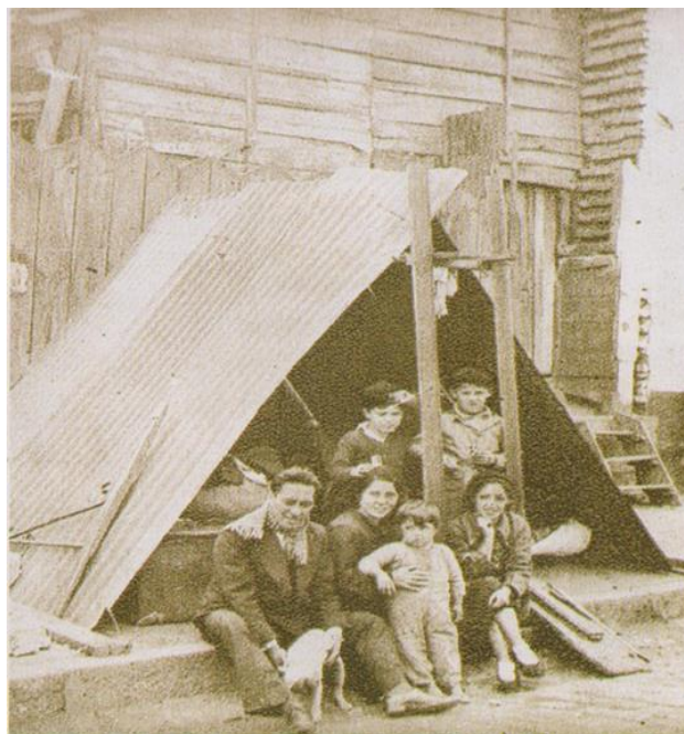
Imagen N°4. Familia damnificada viviendo a las afuera de su casa destruida.