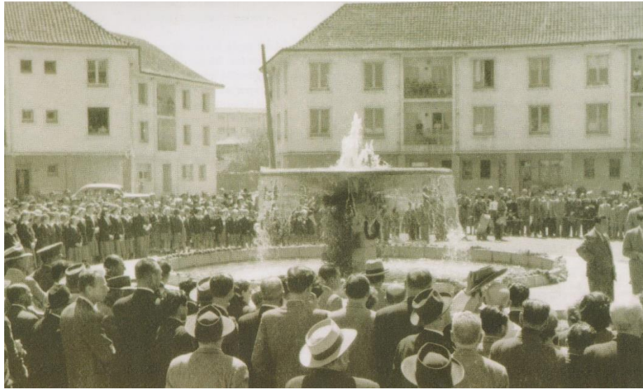
Imagen N°8. Inauguración de la Plaza Perú, año 1950.