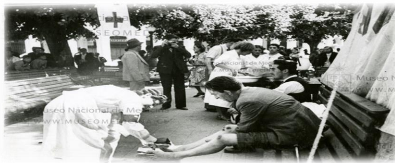
Imagen N°6. Atención de vecinos en la Plaza de Armas