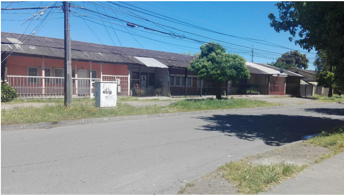
Imagen N°12. Conjunto de Pabellones de Emergencia ubicado en la calle Orompello, entre Ejército y Juan de Dios Ribera.