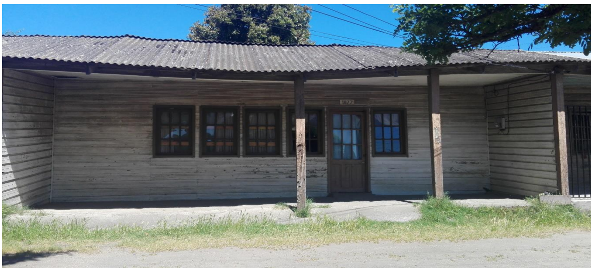
Imagen N°11. Vivienda que mantiene intacta su fachada desde su construcción en el año 1939, parte del Pabellón de Emergencia ubicado en la calle Orompello, entre calle Ejército y Juan de Dios Ribera.