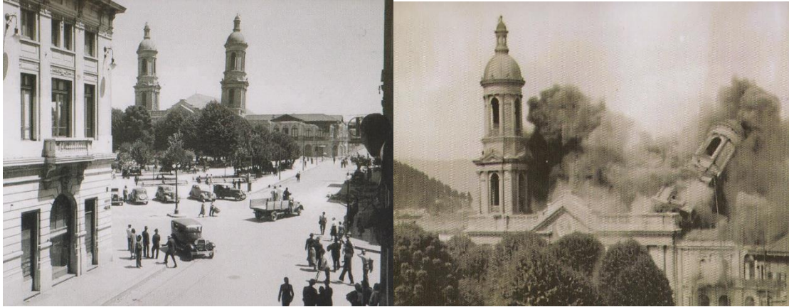
Imagen N°7. Inclinación y posterior derrumbe de las torres de la Catedral.