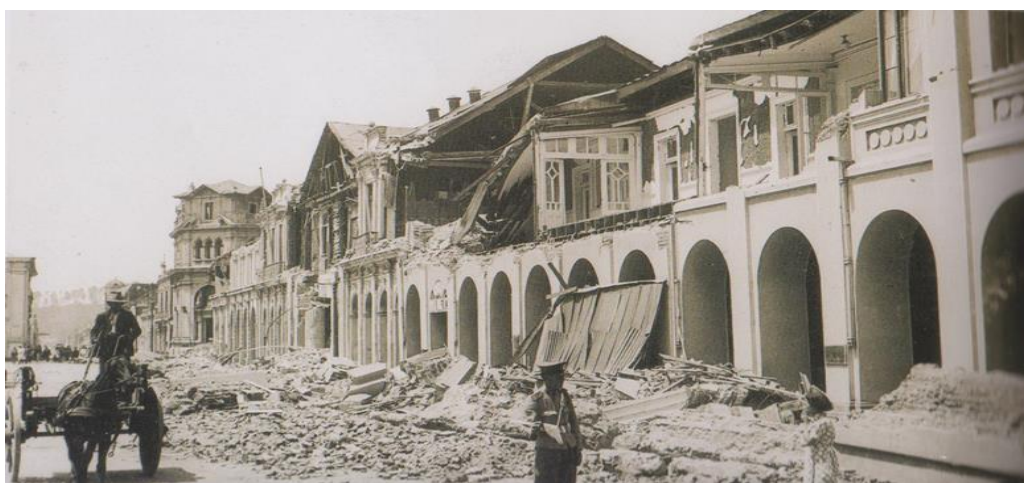
Imagen N°5. El Portal Cruz en ruinas.