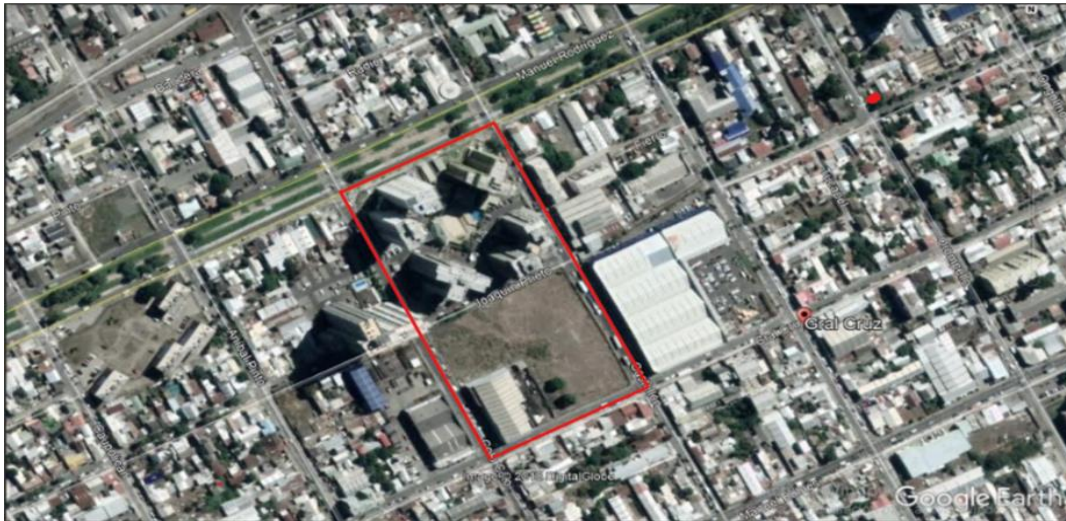
Imagen N°13. Perímetro de la Población Libertad, Concepción.