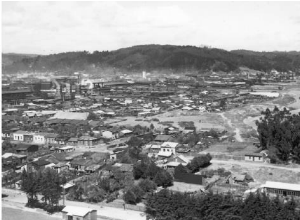
Imagen N1°. Vista panorámica de la ribera del río Biobío, año 1930.